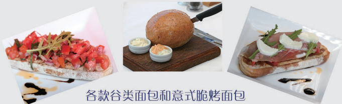
各款谷类面包和意式脆烤面包